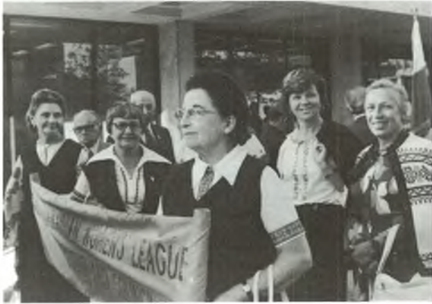
UNWLA members from Ohio during Captive Nations Manifestation.

Союзники Округи Огайо у маніфестаційному поході в Тиждні Поневолених Націй