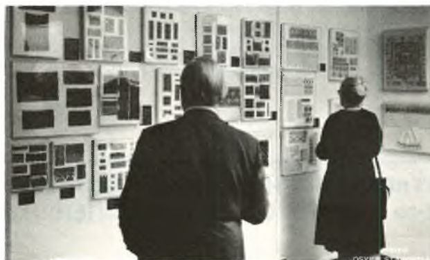
Фрагмент виставки в Українському Музеї — Вишивки. Part of the exhibit in the Ukrainian Museum — Embroideries.

член міської ради міста Нью-Йорку Мерієн Фрідлендер та кандидат на президента дільниці Мангетену Роберт Вагнер, молод.