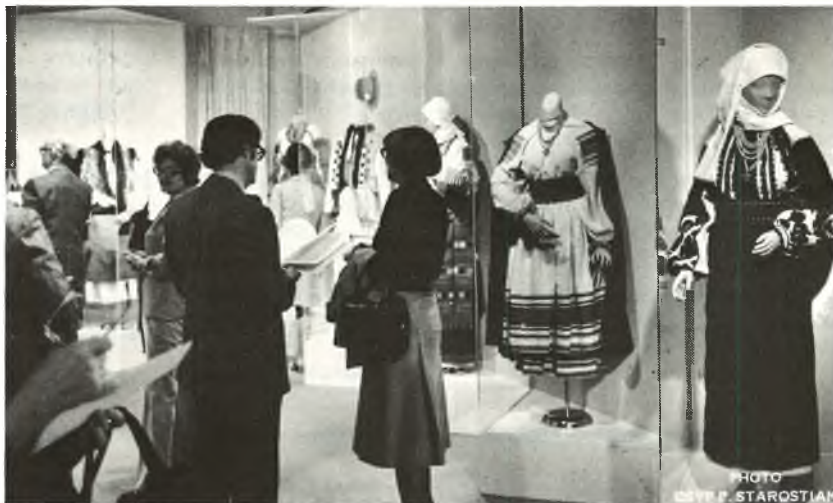
Фрагмент виставки в Українському Музеї — Одяги Part of the exhibit in the Ukrainian Museum — Costumes.