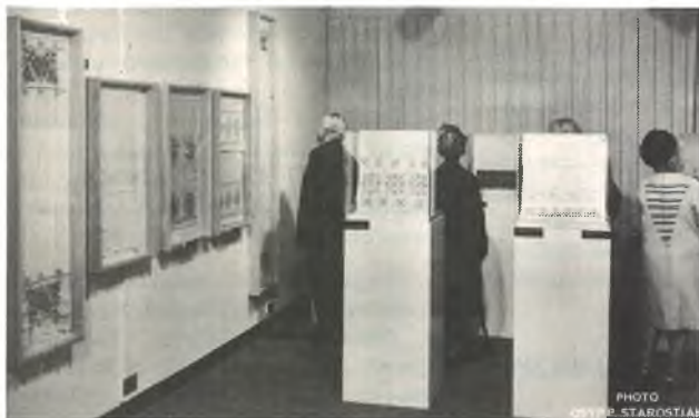
Part of the exhibit in the Ukrainian Museum — Ritual cloths (Rushnyky)