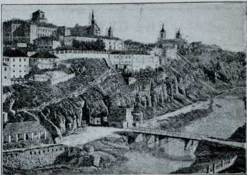
A View of the City of Kamianetz