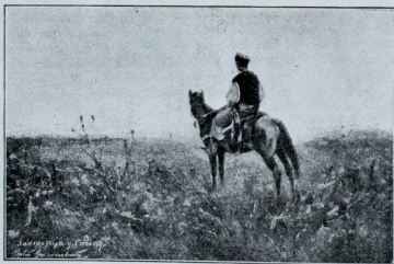
Запорожець у степу